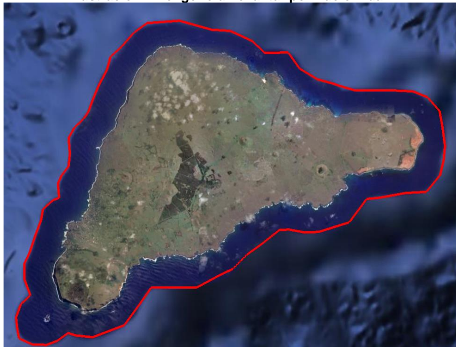
Ilustración 1 Polígono a Levantar por Vuelo Lidar.

Este levantamiento contempla la captura de imágenes de alta resolución (10 cm de resolución) y data LIDAR de toda la superficie terrestre de Rapa Nui y de un buffer marítimo de 2km (aprox.) para todo el territorio que incluirá sus islotes y la generación de un producto cartográfico vectorial. 2